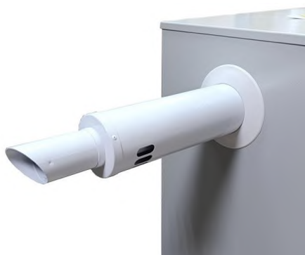
Рис. 1. Пример монтажа дымохода и накладной манжеты

Внимание! При установке заглушек внутри термобокса необходимо установить систему контроля по природному (сжиженному) и угарному газу.